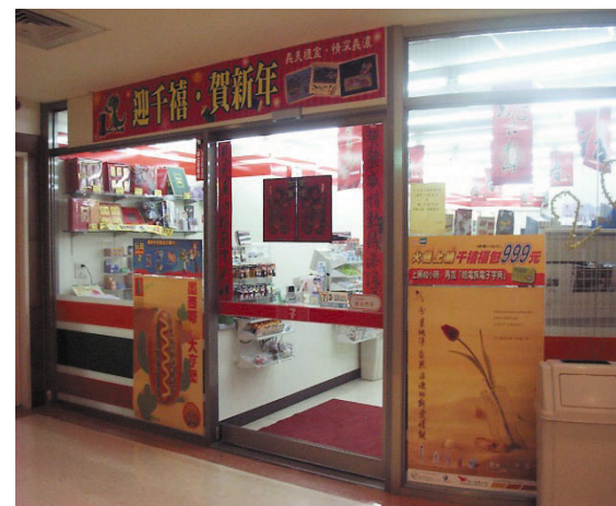
門診大樓一樓及地下室一樓、 醫療大樓一樓