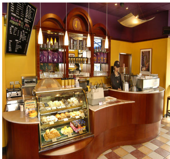
門診大樓一樓雅圖咖啡廳