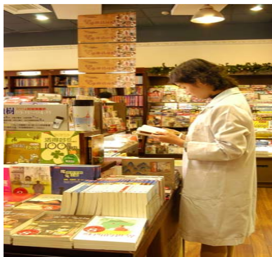
門診大樓一樓金石堂書局